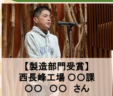
【製造部門受賞】 西長峰工場 〇〇課 〇〇 〇〇 さん

今までこのような大きな賞を頂いた事は無く、大変感激しています。大勢の皆さんの前で緊張の余り今の自分の気持ちを十分にお伝えする事が出来ませんでした。西長峰工場の操業と同時に入社してはや23年。今まで続けて来られたのもアワードを頂いたのも全社員様の温かいお心遣いが有ったのものです。初心を忘れず緊張感と責任感を持って作業に当たります。この場を借りて御礼申し上げます。