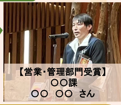
【営業・管理部門受賞】 〇〇課 〇〇 〇〇 さん

この度は年間アワードに選んで頂きありがとうございます。私は入社して15年が過ぎました。その間、色々な事がありました。どんな時も挫けず頑張ってきました。もちろんこの様な賞を頂いたのも、私一人の力だけではありません。素晴らしい上司、先輩、後輩、家族 全ての方が助けてくれたおかげです。本当に感謝しています。今後とも皆様の期待に添えますようにお力添えを頂きながらより一層仕事に邁進して参ります。引き続きご指導頂きますようよろしくお願い致します。