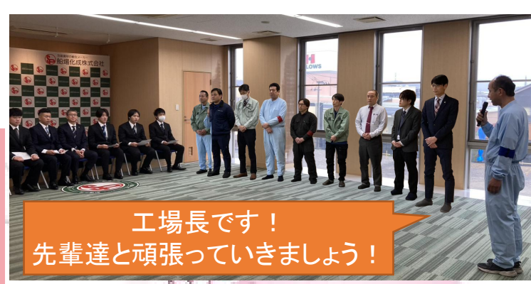
工場長です！ 先輩達と頑張っていきましょう！